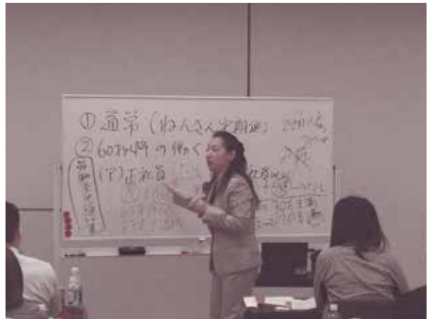
望月氏の講義風景