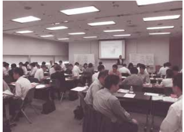
グループワークの風景